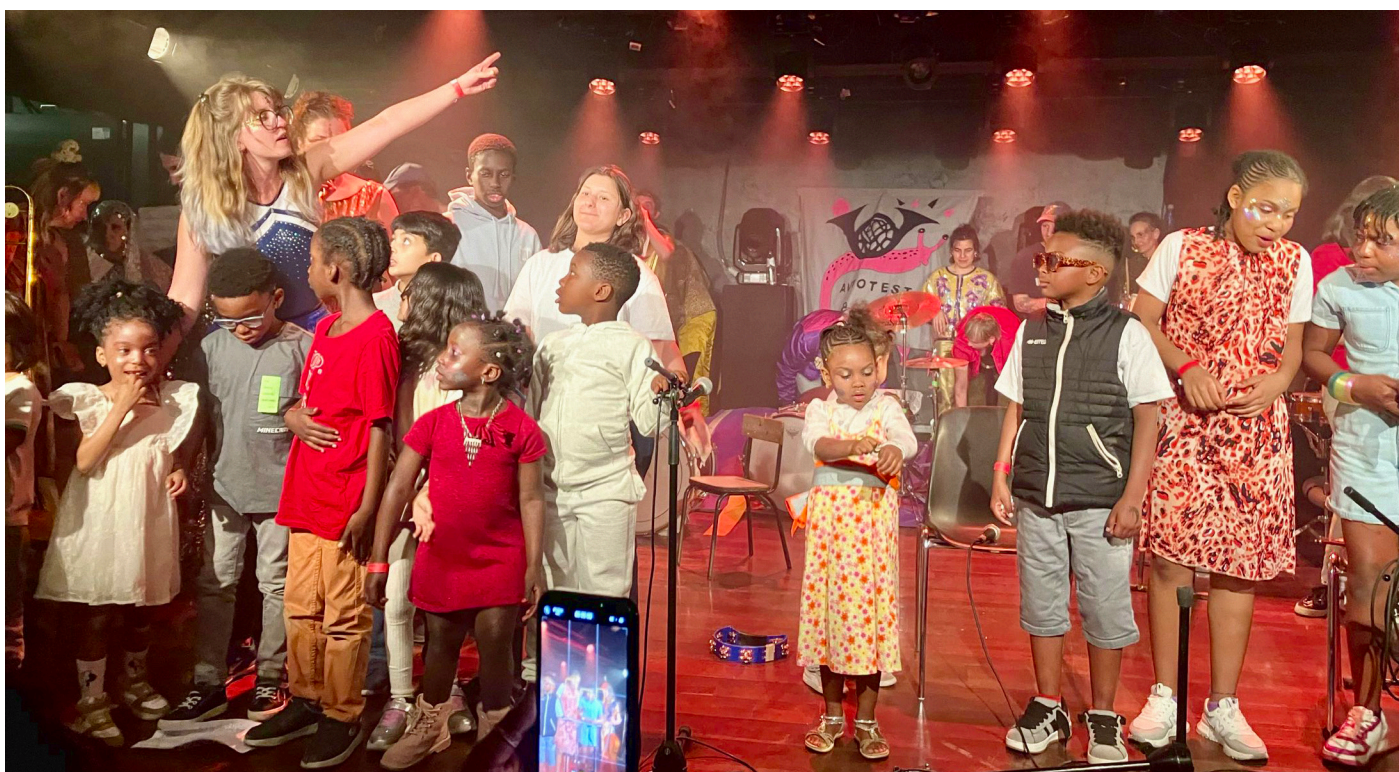
Concert aux Halles de Schaerbeek (2025)