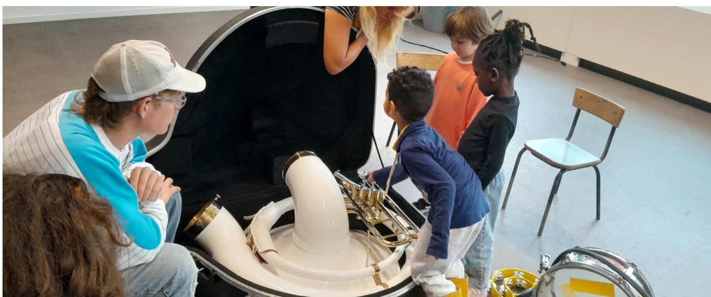
Ateliers Montgomery (2025) & éveil musical (2025)