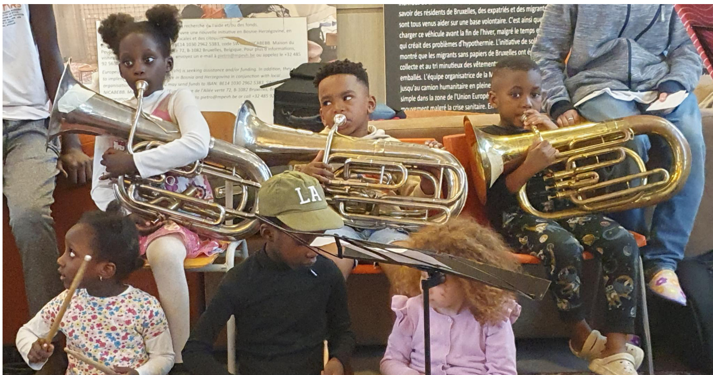
Ateliers Rue du Trône (2023) et Avenue de la Couronne (2024)