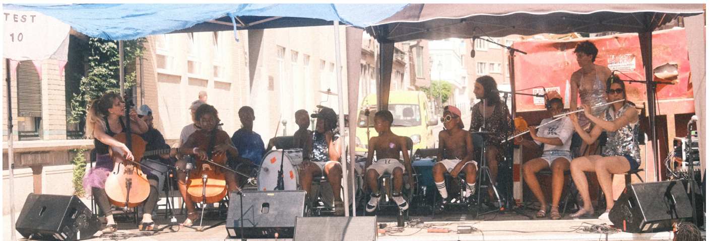
Concerts au Cinéma Nova (2024), à Rockin'Squat (2025) & aux Ateliers 210 (2025)